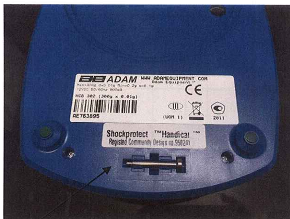
Рисунок 2 – Место нанесения свинцовой пломбы